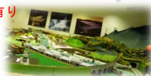
鉄道ジオラマ 市立五條文化博物館