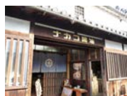
新町口(ナカコ将油前)