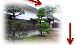
民俗資料館長屋門長屋門下駐車場