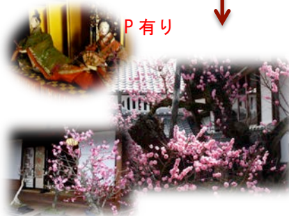
盆梅・長兵衛梅・ひな人形・藤岡家住宅