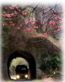
幻の五新線跡(通常通行不可)