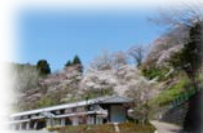
賀名生の里歴史民俗資料館