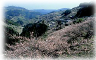
2万本の梅が咲く賀名生梅林