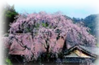
重要文化財堀家住宅