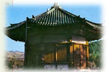
栄山寺八角堂 (国宝)