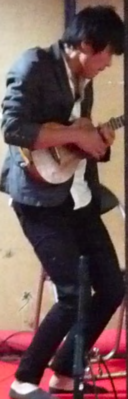
ウクレレ奏者 フック