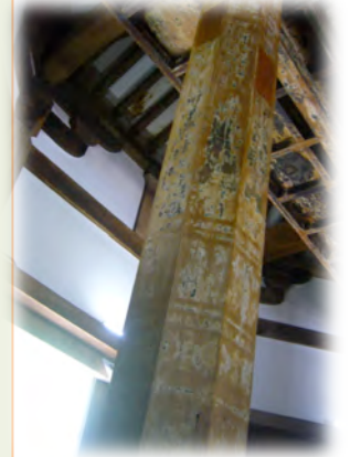
栄山寺八角堂内陣装飾 (重要文化財)