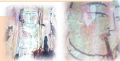
内陣装飾・楽人の図