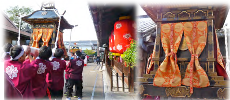
御霊神社 神輿（新町通りにて）