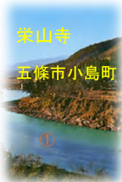
栄山寺 五條市小島町