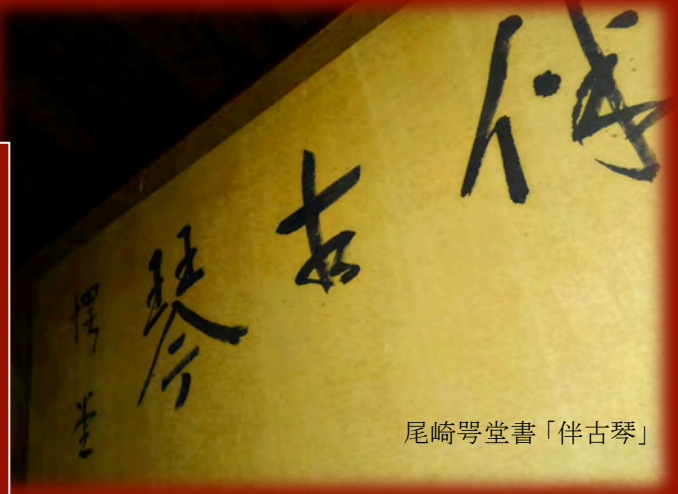
尾崎号堂書「伴古琴」