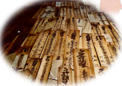
藤岡家に残る金剛山祈禱札