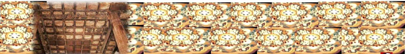
写真 上/栄山寺八角堂天井画を復元した「宝相華」(市立五條文化博物館 展示資料) 写真下 与謝野晶子筆「源氏物語礼賛」(藤岡家所蔵)