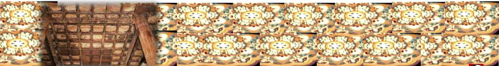
写真 上/栄山寺八角堂天井画を復元した「宝相華」(市立五條文化博物館 展示資料) 写真下 与謝野晶子筆「源氏物語礼賛」(藤岡家所蔵)