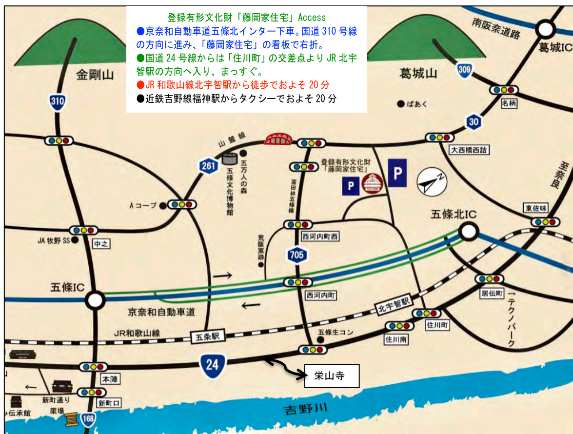
栄山寺は吉野川沿いにある古刹です。国道 24 号線、五條消防署の交差点から吉野川方向に入って下さい。

ご予約・お問い合わせ NPO 法人うちの館（やかた） 〒637-0016 奈良県五條市近内町 526 電話とファックス 0747 (22) 4013 ホームページは「うちの館」で検索して下さい。