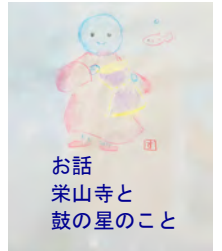
お話 栄山寺と 鼓の星のこと

令和元年 6 月 5 日 (水) 午後 1 時半～ 会場：登録有形文化財「藤岡家住宅」