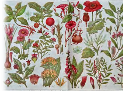
『大植物図鑑』薬用植物図