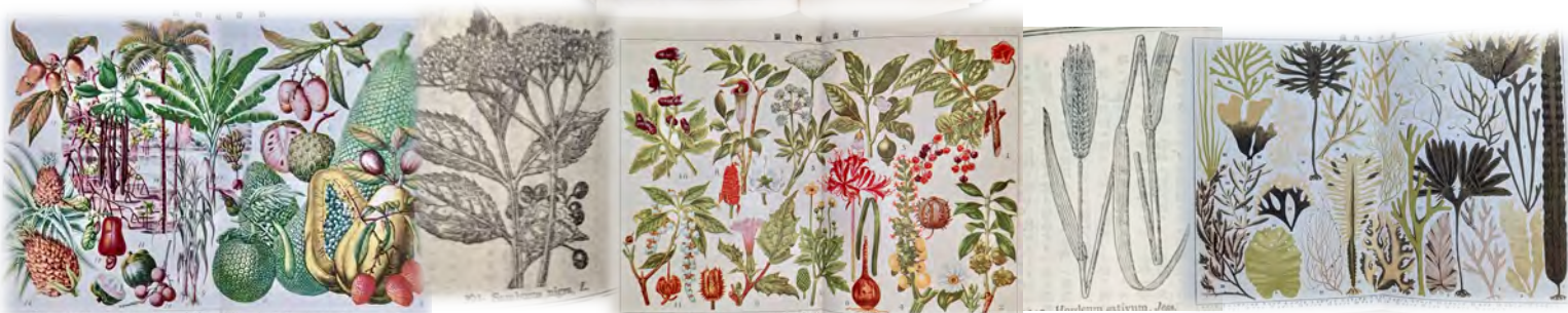
『大植物図鑑』より左から 熱帯植物図・セイヨウニハトコ・薬用植物図・オホムギ・海藻