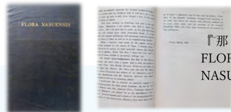
『那須の植物 FLORA NASUENSIS』