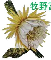
タイリンバシラ Cereus Grandiflorus, Mill 『女子園芸新教科書』