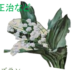
スズラン Lily-of-The Valley(Convollharia majoris Linn)『女子園芸新 教科書』