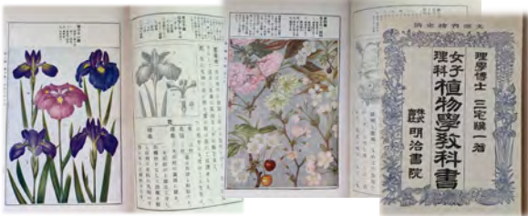
『女子用植物学教科書』理学博士 三宅驥一 著 明治書院 大正14年。

文久2年土佐国佐川村(現高知県高岡郡佐川町)で生まれた 牧野富太郎 は、江戸時代の本草学に大きな影響を受けました。江戸時代の植物図を取めた『古今書譜』(寛文12年・1672年)、本草学の書『廣益薬性分類霊実能毒大成』(正徳5年・1715年)、『諸用咒秘事文庫』(安永2年・1773年)、『昼夜重宝記』(安永7年・1778年)、『博物新編』(明治5年・1872年)他も併せて展示します。