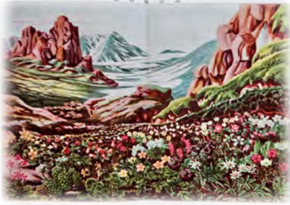
『大植物図鑑』高山植物図